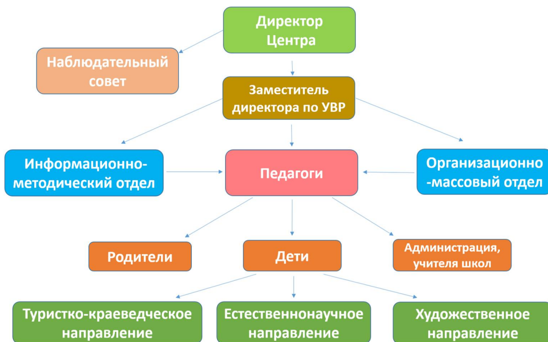
Рис. 1 Структура работы ДЭБЦ №4

- Наблюдательный совет рассматривает вопрос об изъятии имущества, закрепленного за Центром на праве оперативного управления, финансово-хозяйственной деятельности Центра, о совершении крупных сделок, о выборе кредитных организаций, в которых Центр может открыть банковские счета, проведения аудита годовой бухгалтерской отчетности Центра.